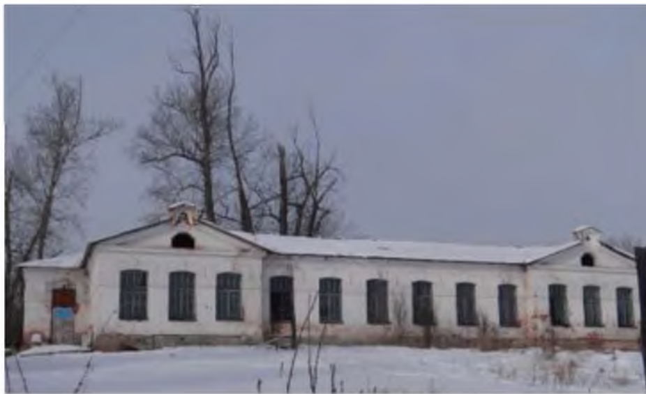
Рис. 1. Одноэтажное каменное здание, принадлежащее Иркутской сельскохозяйственной школе. Февраль 2023

мы еще более осознали сложность задачи освещения достоверной истории сельскохозяйственной школы в Жердовке.